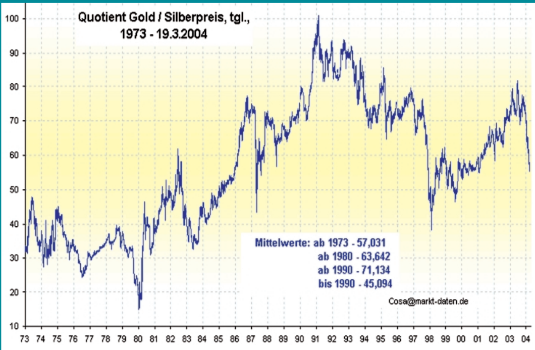
ABB. 2: DAS GOLD-SILBER-PREIS-RATIO VON 1973 BIS 2004 – 1980 ERREICHTE DAS GSPR WIEDER DAS HISTORISCHE MITTEL VON 15